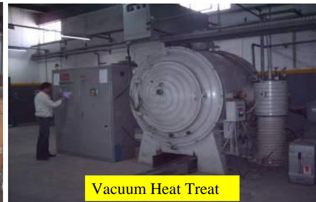
Vacuum Heat Treat