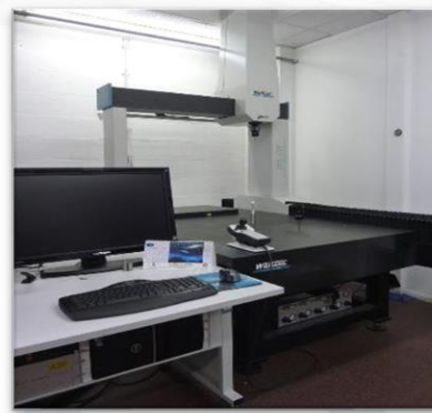
Machine tridimensionnelle CNC