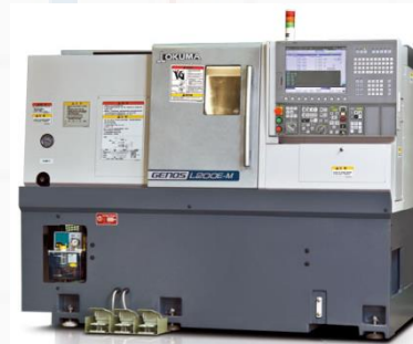
GENOS L200 E-M