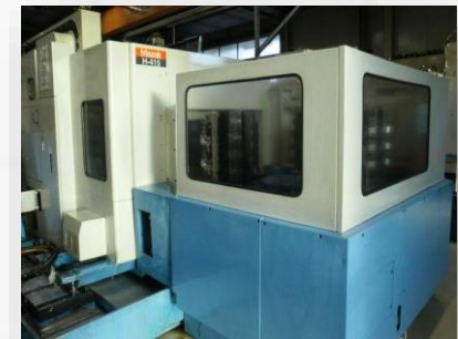
Mazak H415 – 6 Palette