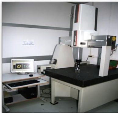
Machine tridimensionnelle manuelle