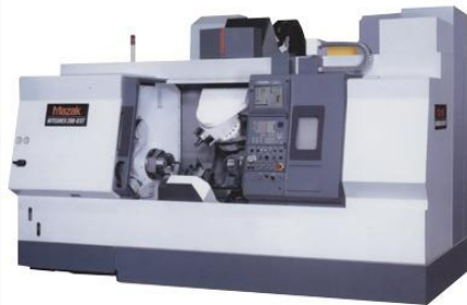
Mazak Integrex 200Y