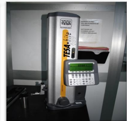
Colonne de mesure